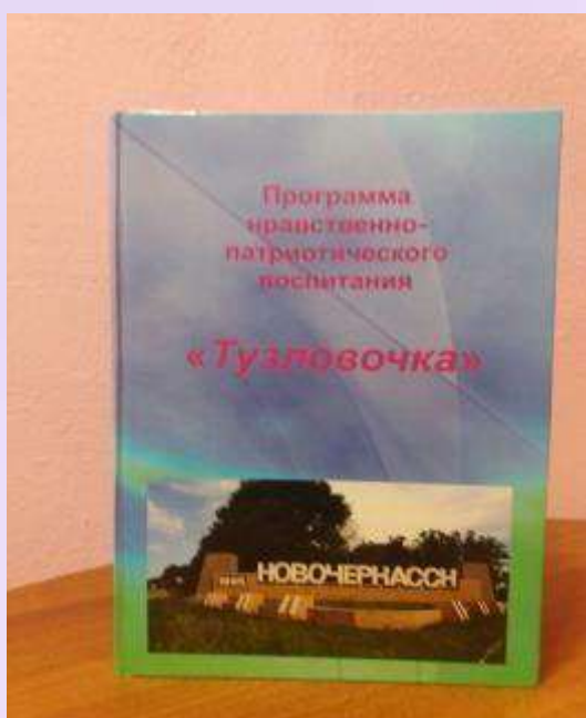
Тузловочка, МБДОУ детский сад № 57