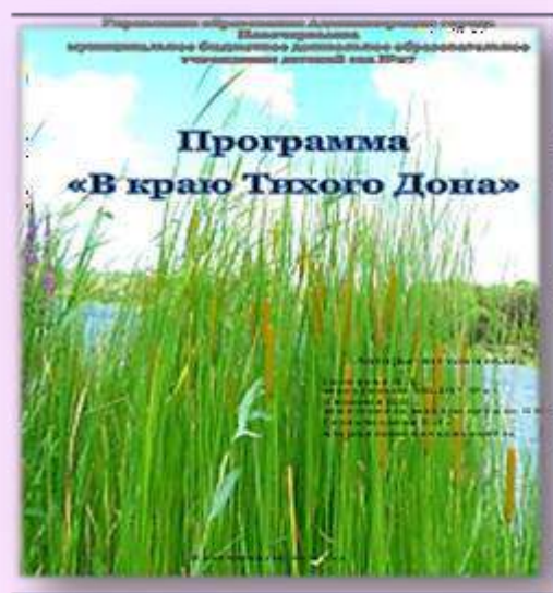
В краю Тихого Дона ММРЦ детский сад №